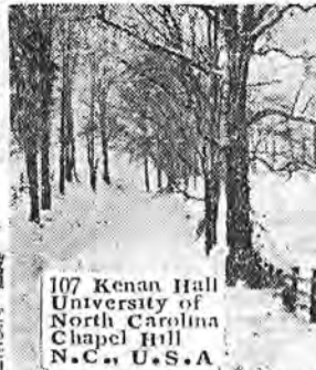
107 Kenan Hall University of North Carolina Chapel Hill N.C., U.S.A.