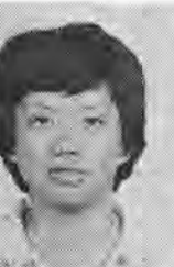
容 應 爽