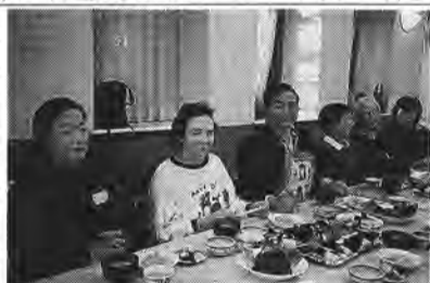
お料理で楽しい交流、ドイツ(左から2人目)とアメリカ(右から2人目)のお客様