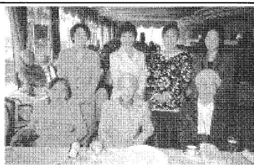
岐阜支部親睦会 2005年3月

「JAUW」210号に「細々とやっております。支部だよりを載せていた。しかし本年度は、全くだいてから2年半。岐阜支部は、有力新人をひとり迎えたが、転出者あり相変わらず11名。