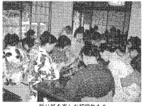
折り紙を楽しむ留学生たち

色の折り紙が出て盛り込んでしまっで、「中の見たえる箱」の製作を楽しんだ。約半数の留学生は浴衣姿で楽しそうに帰っていった。やや足元不安の下駄履きやビーチサンダル姿を見送った私たちは、無事、成功裡に終わった。この催しにご協力下さった多くの方々に、心から感謝いたします。「留学生と日本文化を学ぶ会」は、日本に滞在している留学生と共に日本文化に接し、相互の理解から国際親善の一助にしたい。また、社団法人大学婦人協会の社会貢献としての事業の一端でもあると考えている。