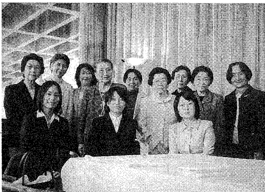
2006年11月18日(土) 支部奨学賞贈呈式

11月には、いつも、支部のメイン行事として、奨学賞の贈呈式がある。平成18年度は57回目となる。受賞者は、当初1〜2名の時もあつたらしいが、現在は4〜5名。