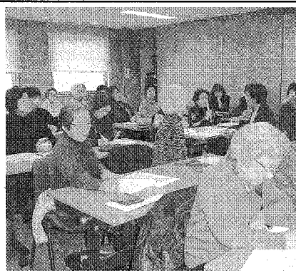
説明を聞く東京支部会の方々