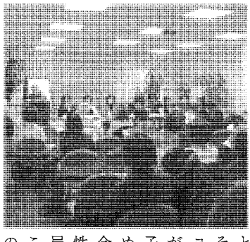
物に入った箱と飲み物を分科会から二つずつ政府開会議に出す提案のま...