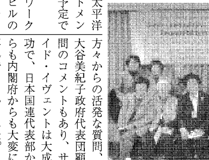
三月四日の午後、一番最後に予定されていた日本政府代表のステートメント...