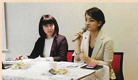
◆毎回、様々な方面で活躍される方々にお越しいただき、熱のこもったお話を聞かせて頂きます。