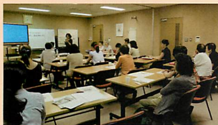
◆回が増えることに参加者も増えていきます。