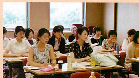
◆参加者側も、とても真剣。意見交換では、多くの質問や感想を述べあいました。