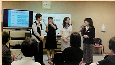
◆アサーティブトレーニングでは、ロールプレイをしながら、自己分析しアサーティブな姿勢を学びました。